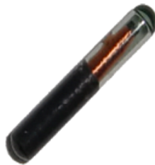
图 1-1. TRPGR30ATGC 应答器